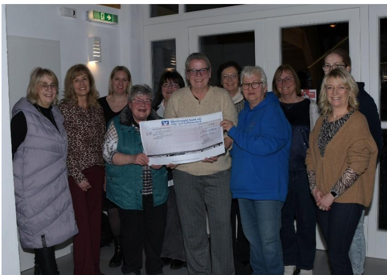
@ Karina Baumgart

Frau Platzer von der Initiative Wohlfühlbeutel teilte mit, dass der gemeinnützige Verein 2020 gegründet wurde. Ein handgearbeiteter Wohlfühlbeutel enthält hochwertige Pflegeprodukte, Bücher etc., die an Patienten verschenkt werden, die sich in einer Krebs-/Strahlentherapie befinden oder danach.